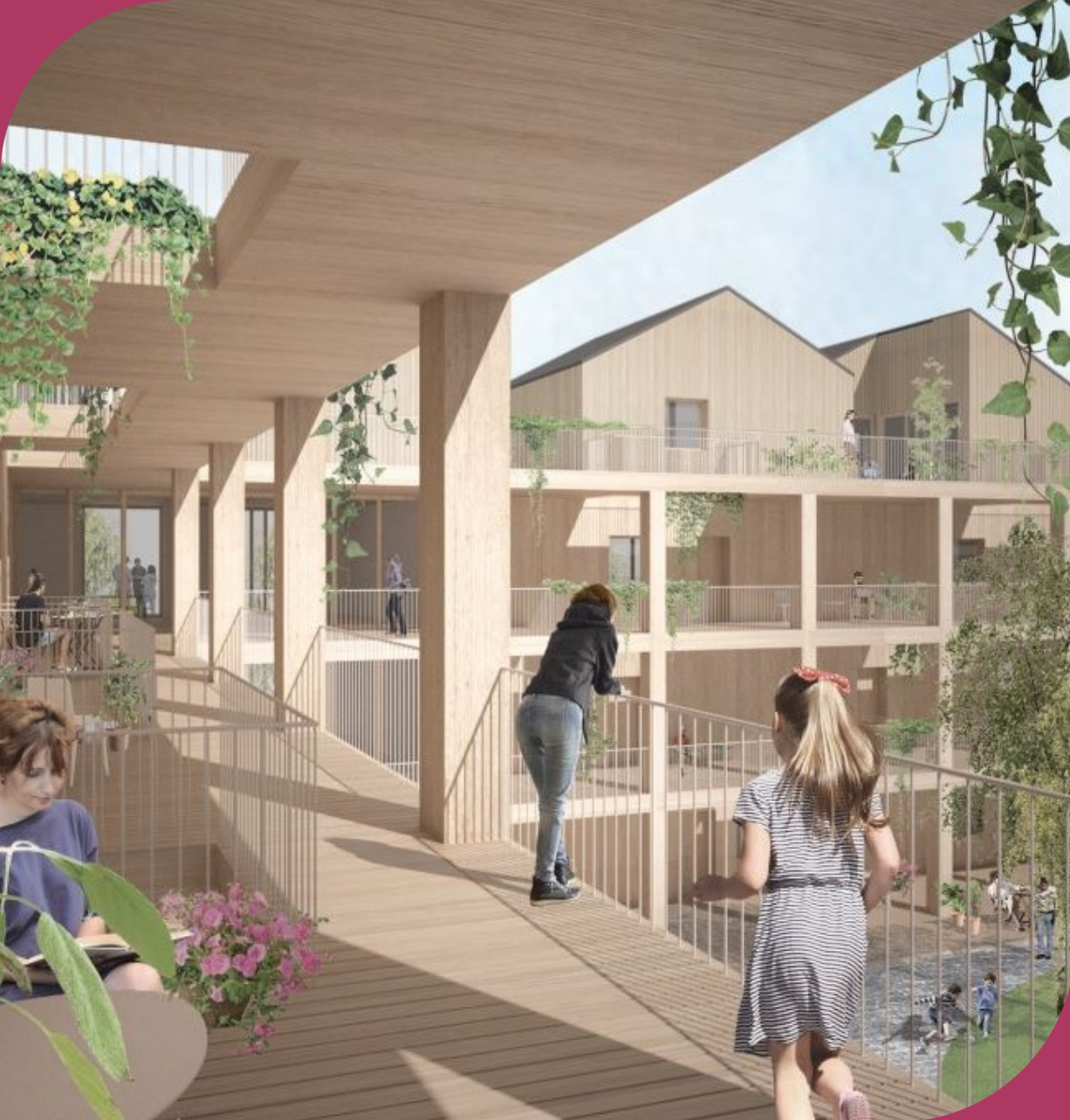
Asuntoreformi 2018-kilpailun voittajaehdotus Kide